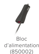
Bloc d'alimentation (850002)